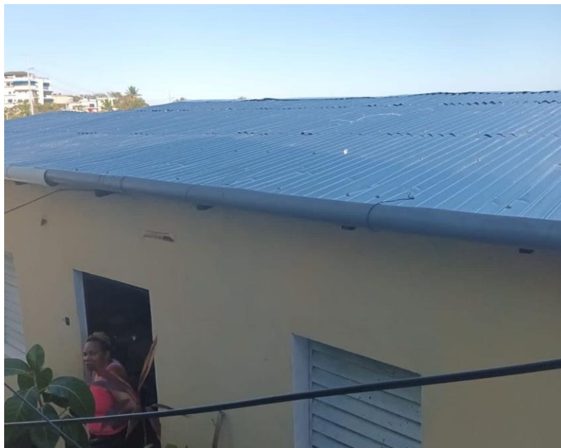
Antes y después