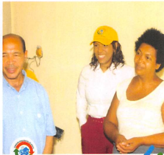
COMISIÓN BARRIAL BENEFICIA IGLESIA CON BATERÍAS PARA INVERSOR EN SABANA PERDIDA

La Comisión Presidencial de Apoyo al Desarrollo Barrial benefició a través del departamento de Asistencia Social, a la iglesia Dios Tiene la Respuesta, con la entrega de baterías para inversor en la localidad Barrio Nuevo de Sabana Pérdida.