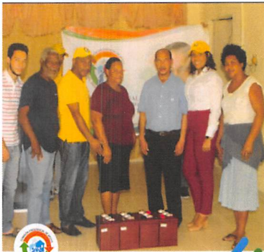
COMISIÓN BARRIAL BENEFICIA IGLESIA CON BATERÍAS PARA INVERSOR EN SABANA PERDIDA